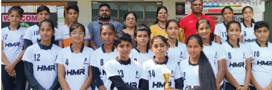
स्वास्तिक न्यूज/सुनील कमनिया

पानीपत। आर्य गर्ल्स पब्लिक स्कूल भारतीय राष्ट्रीय खेल हॉकी में उत्कृष्ट प्रदर्शन के लिए विशेष रूप से जाना जाता है।