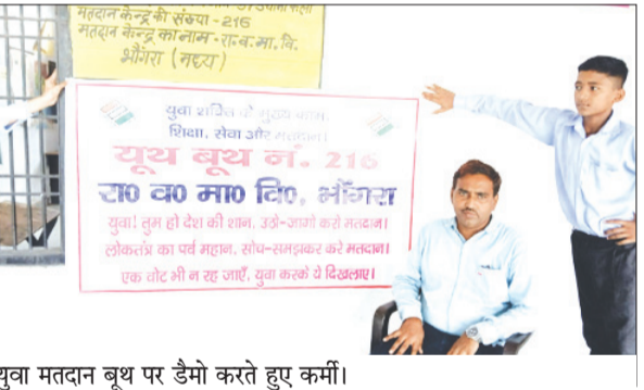
युवा मतदान बूथ पर डैमो करते हुए कर्मी।

जींद। स्वीप कार्यक्रम के तहत मतदाताओं को वोट डालने के प्रति जागरूक किया जा रहा है। इसी कड़ी में शुकवार को उचाना विधानसभा क्षेत्र के भीरगा गांव के राजकीय वरिष्ठ माध्यमिक विद्यालय में बनाए गए युवा बूथ नम्बर 216 पर युवाओं को वोट डालने और उन्हें वोट के महत्व के बारे में जागरूक करने के लिए डैमो किया गया। डैमो के तहत मतदाता की वोटर स्लिप का मतदाता सूची में मिलान किया गया मिलात करने के बाद उम्मीदवार के प्रतिनिधियों को भी मतदाता के बारे में नाम व वोटर के बारे में बताया गया और चुनाव से जुड़ी सभी प्रक्रिया की गई। युवाओं को