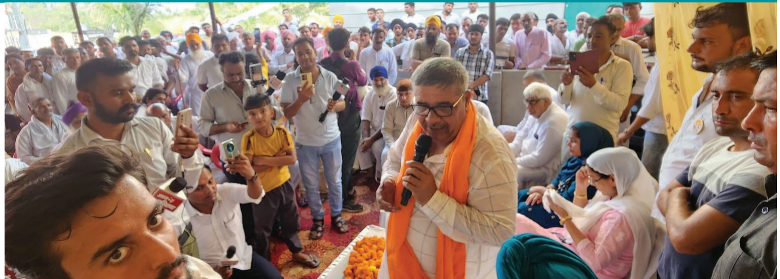
स्वास्तिक न्यूज/अभिषेक दिवान

पूर्ण बहुमत की सरकार के लिए मुख्य रूप से भिड़त इन्हीं दो दलों के बीच में हैं।