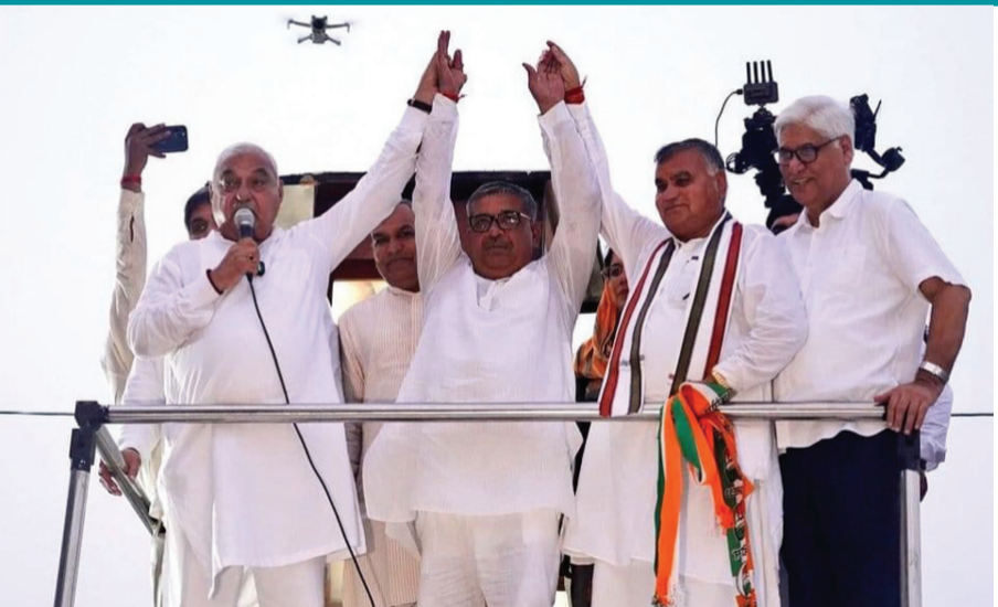
स्वास्तिक न्यूज/अभिषेक दिवान

सफीदों। हरियाणा में विधानसभा चुनाव के अब महज 2 हफ्ते बाकी हैं। पूरे हरियाणा में अभी भी सबसे ज्यादा हॉट सीट सफीदों बनी हुई हैं।