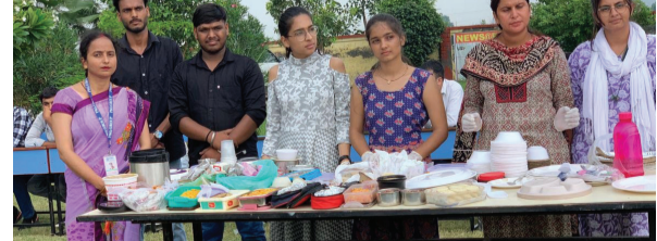
स्वास्तिक न्यूज/सुनील कमनिया

मतलौडा। पीकेजी गुप ऑफ इंस्टिट्यूशन मतलौडा में वीरवार को बीसीपी, बीबीए व एमबीए विभाग के छात्रों द्वारा पाॅटलक कार्यक्रम का आयोजन किया गया। इस कार्यक्रम में छात्र-छात्राएं अपने घर से विभिन्न प्रकार के व्यंजन तैयार करके लेकर आए। सभी छात्र-छात्राओं एवं स्टाफ सदस्यों ने सामूहिक रूप से