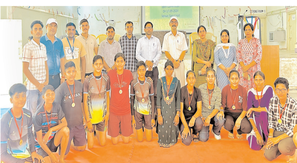
विजेता खिलाड़ियों के साथ कालेज स्टाफ।