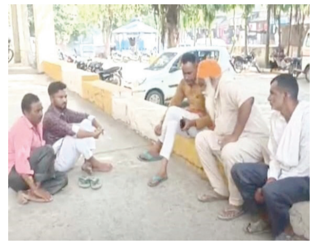
नागरिक अस्पताल में जुटे श्रद्धालुगण।