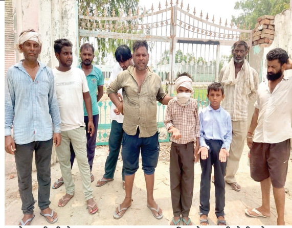
पहले वाली ही ड्रेस पहनकर स्कूल में जा रही थी। इसके लेकर उसकी बेटी को स्कूल में लगातार परेशान किया जा रहा था। पिछले चार दिन से उसकी बेटी को क्लास में इसको लेकर मारा जा रहा था। पांचवें दिन बेटी ने घर आकर रोते-रोते सारी बातें बताईं। उसकी छोटी