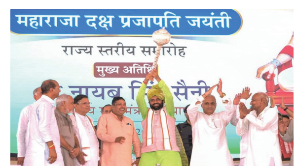
महाराजा दक्ष प्रजापति जयंती